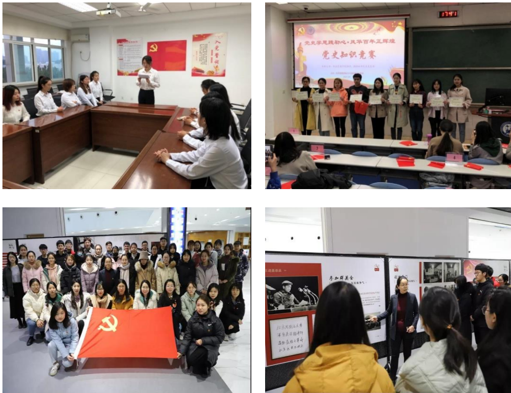
图2 党建与思想政治教育活动

把思想政治工作作为研究生培养的生命线，以深化“三全育人”综合改革为抓手，依托铁人精神教育基地、宣讲团、党史知识竞赛、新时期铁人风采展、重温入党誓词等一系列铁人文化项目，引导师生积极参与铁人文化建设与传播。明确服务国家能源战略的使命和担当，厚植师生爱党、爱校、爱专业的家国情怀。