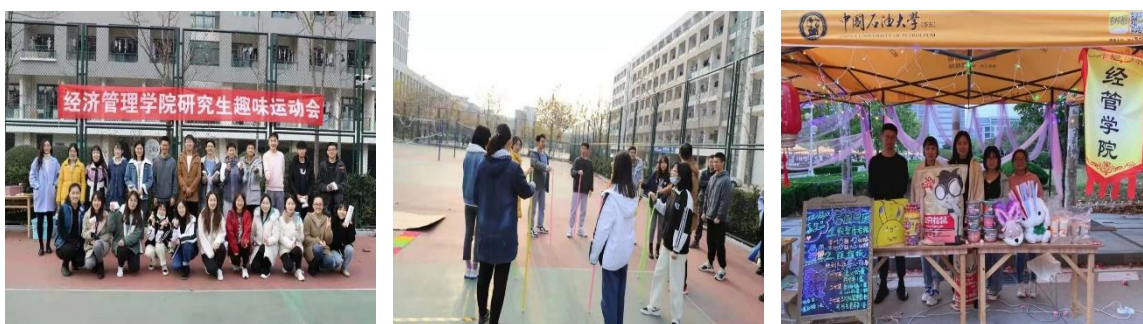
图 3 文体活动

青春逢盛世，奋斗正当时！为了弘扬“全民健身、勇于奋斗”新时代研究生精神风貌，组织了趣味运动会、中秋游园、校园生活心得征文等丰富多彩的文体活动，促进研究生之间的了解，加深同学间友谊、缓解科研压力，丰富我校广大研究生的课余生活。例如，2021 年 11 月 25 日下午举办研究生趣味运动会。趣味运动会以“运动、健康、快乐”为主题，能让参赛者在比赛中感受运动的竞技性，体会运动的趣味性。