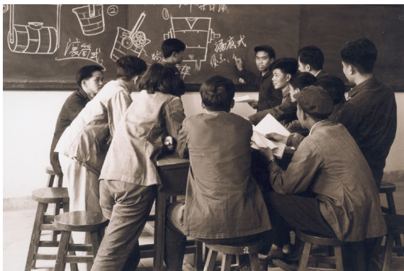
北京石油学院的年轻教师

这支队伍首先是拥有一批全国著名的专家、教授作为学术带头人。系主任曹本熹教授于20世纪40年代留学英国，为英国皇家学会会员，1946年筹建清华大学化工系，为首任系主任；后来他调离北京石油学院，参加了我国原子弹的研制工作，为“两弹一星”功勋获得者之一，