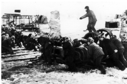
北京石油学院师生在大庆参加石油会战

石油炼厂机械等六个专业，都是 1952 年全国高校院系调整时，在清华大学石油系创立的。当时，全国高校进行教学改革，提出来“一面倒”、“学习苏联”，由于苏联莫斯科石油学院有这些石油专业，所以我国也就照搬过来，建立了相关专业。这六个石油专业中，除了石油炼制及石油炼厂机械两个专业与化工密切相关，我国还算有些基础之外，其他几个专业在我国高校中从未设立过，因此，均是“白手起家”创建。