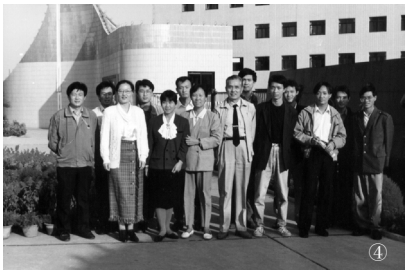
④ 与研究生和博士后合影（1994年）