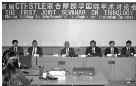
② 主持中美 CTI-STLE 摩擦学学术会议 (北京, 2002 年)

总之，在校长岗位上 10 年的经历，使我深刻地认识到高等学校既不是行政单位，更不是企业，它的主要任务是培养高层次的人才。因此，作为校长，不应当把自己看成是行政干部，更不是“官”，而应当努力使自己成为一名称职的教育工作者。所谓“称职”，就是要努力认识教育规律，认真遵循教育规律。遵循教育规律，教育事业就兴旺发达，违背教育规律，必将对学校的建设与发展造成无可挽回的损失，这是我切身的感受。这也是我校历经坎坷、三次建校应当吸取的经验教训。认识规律很难，自觉地遵循规律更难。但是要想真正办好一所大学，只有老老实实在地按教育规律办事，没有其他任何捷径。基于上述认识，1998 年 9 月 28 日在校庆 45 周年之际，我在《石油大学报》上发表了一篇题为《必须坚持按教育规律办事》的文章，这也算是我在 10 年校长生涯中、办学的反思与总结吧。