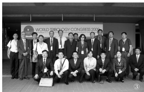
③ 参加第四届世界摩擦学大会的中国代表合影 (京都, 2009 年)