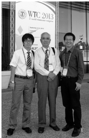
① 与参加第5届世界摩擦学大会的学生合影（都灵，2013年）

为了改善办学的外部环境，开展联合办学，我组织有关的院系和处室，采取走出去和请进来的方式，和英、美、加拿大、俄罗斯、罗马尼亚、泰国